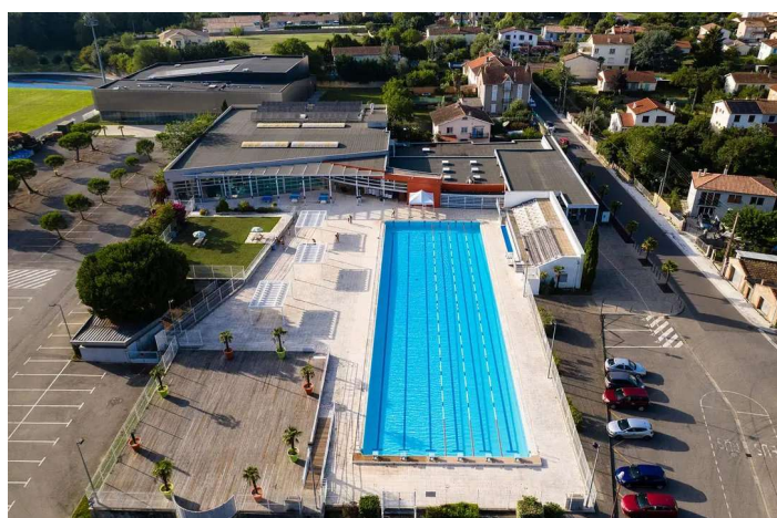
Bassin de 50 m extérieur